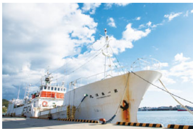
老朽化が進む漁船は代船へ切り替え予定。

参加漁業6社が株式会社化を受け入れたのは、グループ操業の成果を実感できたことが大きかった。2016～2017年に「がんばる漁業」の取り組みとして、6社で漁場の情報を共有したり、各社の漁