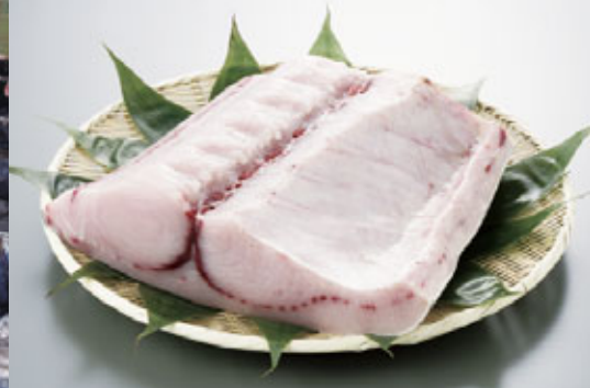
気仙沼地域の近海マグロはえ縄漁業は、主にメカジキ・ヨシキリザメを漁獲し、全て生鮮で気仙沼市魚市場へ水揚げされる。