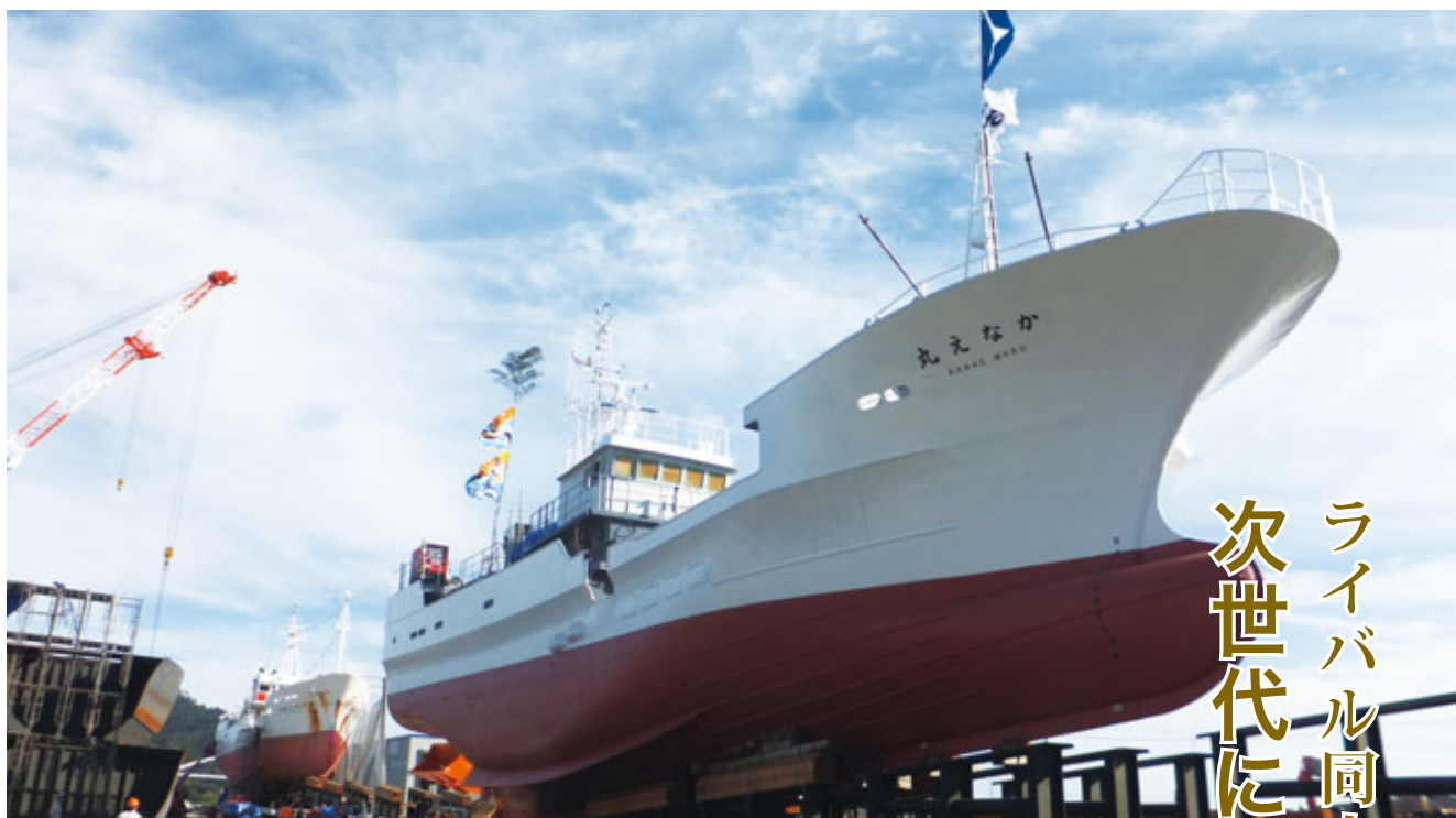
気仙沼かなえ漁業株式会社の「かなえ丸」(149トン、14人乗り)。

2019年9月10日、気仙沼かなえ漁業株式会社所属の近海マグロはえ縄漁船が気仙沼市魚市場に初水揚げした。気仙沼近海漁業の生き残りを懸けて、地元漁業6社による新会社設立の取り組みをレポートする。