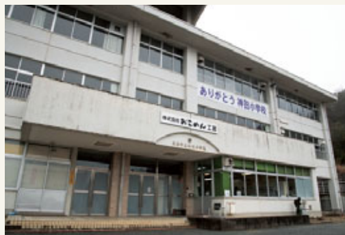
おこめん工房の本社工場は、廃校となった小学校を活用しており、三原市の米粉専用の低温貯蔵庫、増田製粉の工場に隣接している。