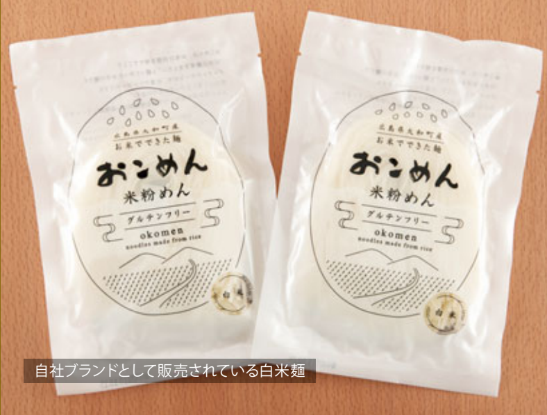
自社ブランドとして販売されている白米麺