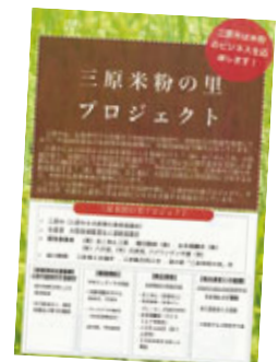
三原米粉の里プロジェクトのパンフレット

全国トップランナーとなる米粉ビジネスのクラスターを目指し、これからも行政として、生産現場と事業者、国内外の市場等をつなぐ役割を果たしていきます。