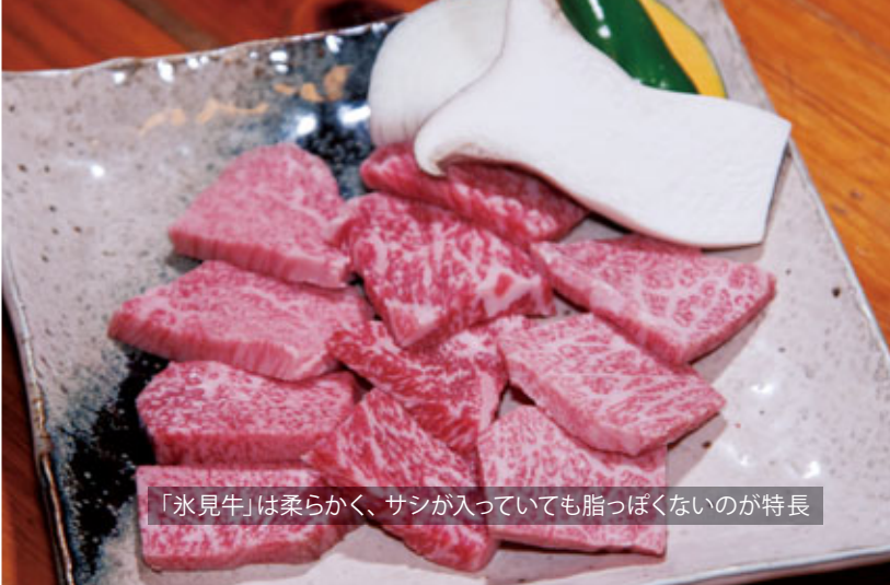
「氷見牛」は柔らかく、サシが入っていても脂っぽくないのが特長