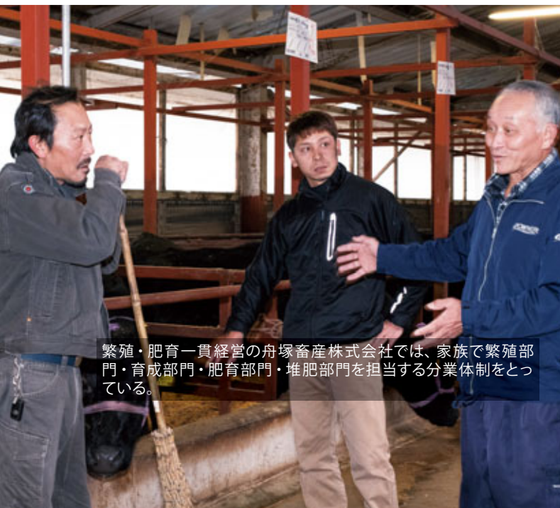
繁殖・肥育一貫経営の舟塚畜産株式会社では、家族で繁殖部門・育成部門・肥育部門・堆肥部門を担当する分業体制をとっている。