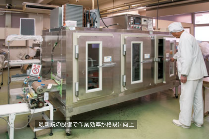
最新鋭の設備で作業効率が格段に向上