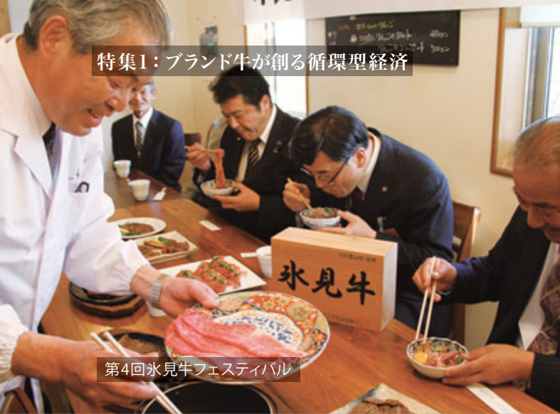
第4回氷見牛フェスティバル