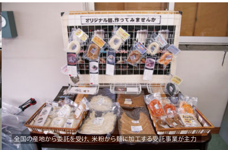
全国の産地から委託を受け、米粉から麺に加工する受託事業が主力