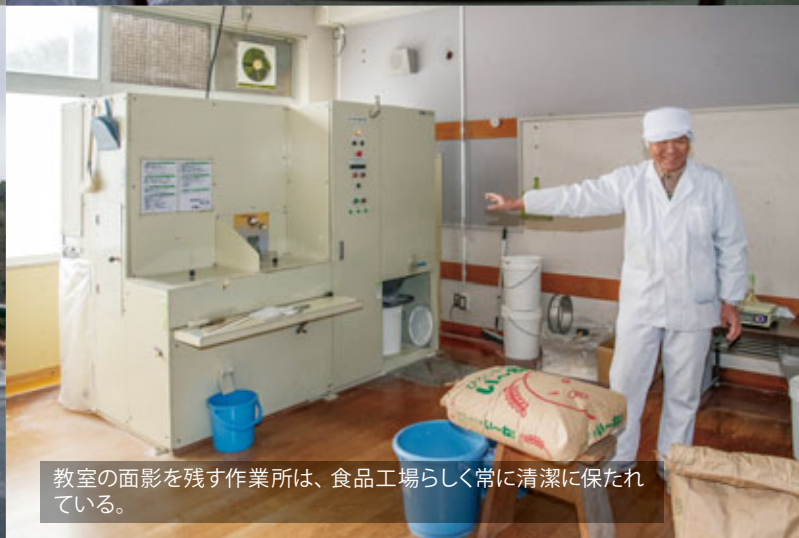
教室の面影を残す作業所は、食品工場らしく常に清潔に保たれている。