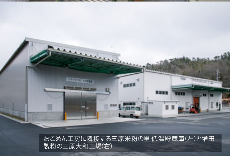
おこめん工房に隣接する三原米粉の里 低温貯蔵庫(左)と増田製粉の三原大和工場(右)