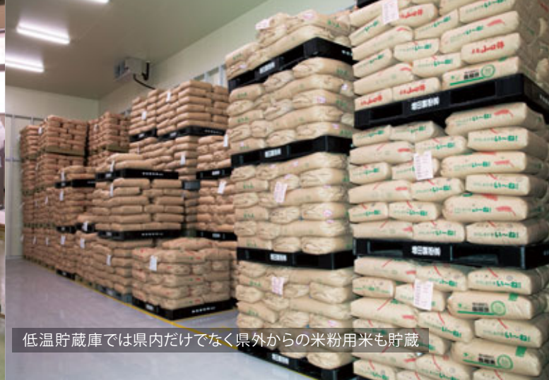
低温貯蔵庫では県内だけでなく県外からの米粉用米も貯蔵