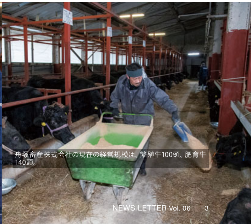
舟塚畜産株式会社の現在の経営規模は、繁殖牛100頭、肥育牛140頭。