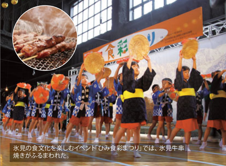
氷見の食文化を楽しむイベント「ひみ食彩まつり」では、氷見牛串焼きがふるまわれた。