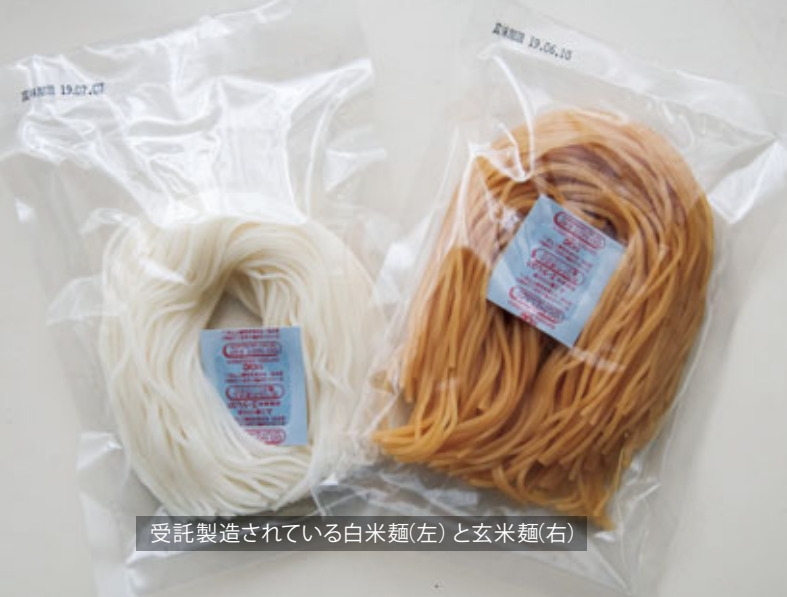
受託製造されている白米麺(左) と玄米麺(右)