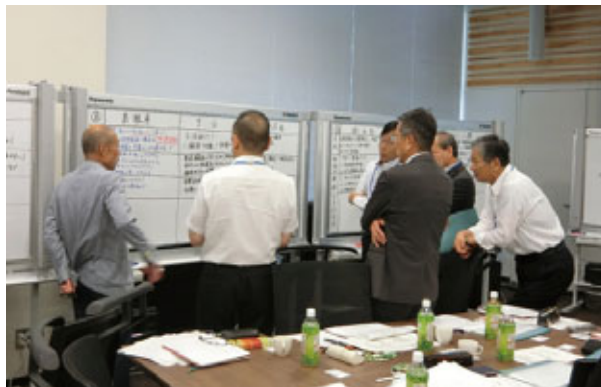
「JAバンク中央アカデミー 経営者コース」

当金庫では、JA(農協)・JA信農連等との人材交流を充実させ、JAバンクグループ内の相互理解やノウハウ共有に努めています。具体的には、信用事業の中核を担う人材の育成や各種業務のノウハウ習得を目的としたJA(農協)からのトレーニーの受け入れ、農業融資・法人融資、リテール企画、事務・システム、有価証券運用などさまざまな業務でのJA信農連からの出向者・トレーニーの受け入れ、協同組織中央機関・専門金融機関の職員としての系統の現場の理解深化を目的とした系統団体(JA(農協)・JA信農連等)への出向派遣を実施しています。