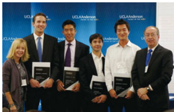
海外留学を通じた専門知識の習得、国際感覚の養成