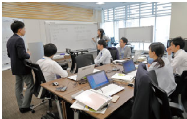
新入職員受入研修