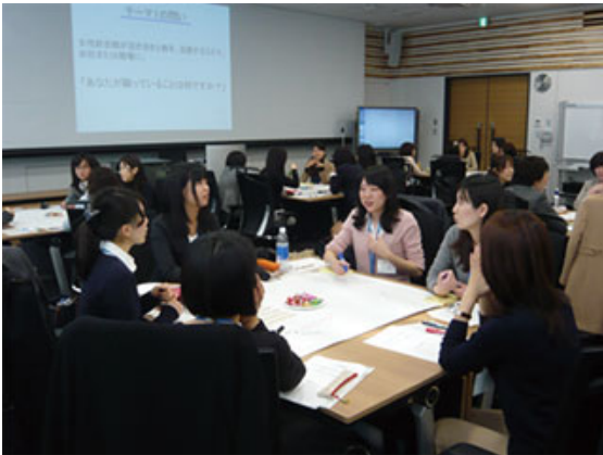
女性職員キャリア開発フォーラム