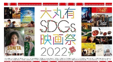
▲ 2022 年度の上映作品

大丸有エリアのイベントスペースやインキュベーションオフィス等をミニシアターに仕立て、まちをあげての映画祭を開催しています。サステナビリティへ関心がなかった人にも映画というツールを活用して、社会課題について触れ、学び、考える機会を提供することを目的としています。昨年度は「難民」や「食」「D&I」等をテーマにした映画を全 10 作品上映し、約 700 名にご参加いただきました。今年度も 9 月頃に映画祭を開催します。