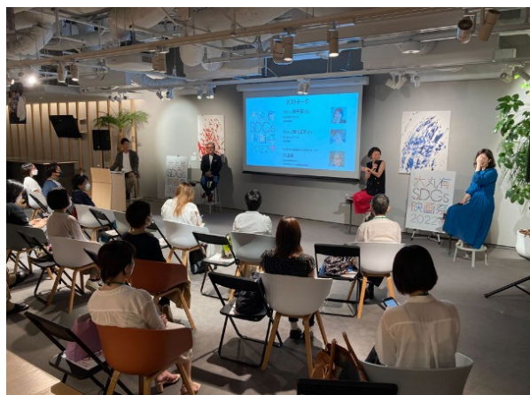
▲昨年度の大丸有 SDGs 映画祭の様子

また、大丸有エリア内で行われる個人のSDGsアクションに「ACT5メンバーポイント」を付与するアプリを、今年度も提供します。ポイントを獲得できる活動や拠点を拡大し、さらに今年度から記事コンテンツを追加いたします。