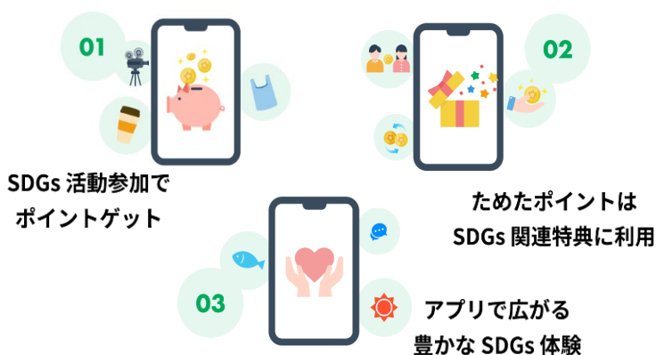
▲ポイントアプリの3つの特徴