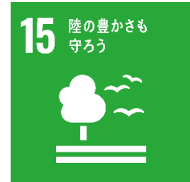
森林の持続可能な 経営

森林・林業分野は、目標 15「陸の豊かさも守ろう」をはじめ、SDGs の様々な目標に貢献しています。一方、林業における産業別死傷年千人率（千人あたりの死傷者数）は、20.8 人（2019 年度時点、全産業平均の約 9 倍）と著しく高い水準にあり、林業従事者の確保のためにも労働安全性の向上は必須の課題となっています。