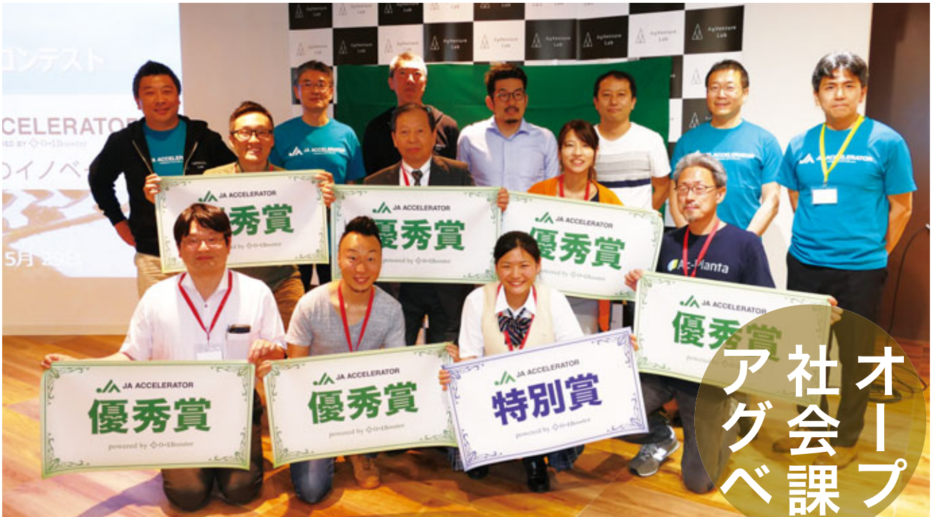
「JAアクセラレーター」のビジネスプランコンテスト受賞者と審査員

次世代に残る農業を育て、地域の暮らしに寄り添い、場所や人をつなぐ「AgVenture Lab (アグベンチャーラボ)」が始まった。新たな事業創出と社会課題解決に取り組むJAグループの挑戦をレポートする。