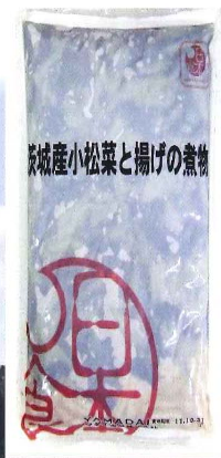
元気ナムル! 茨城小松菜