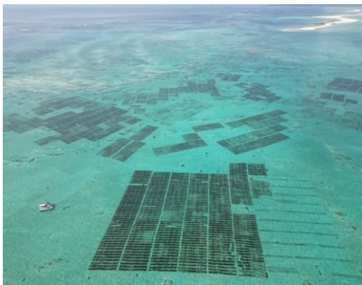
モズク養殖の様子