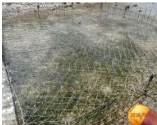
藻場保全活動の様子