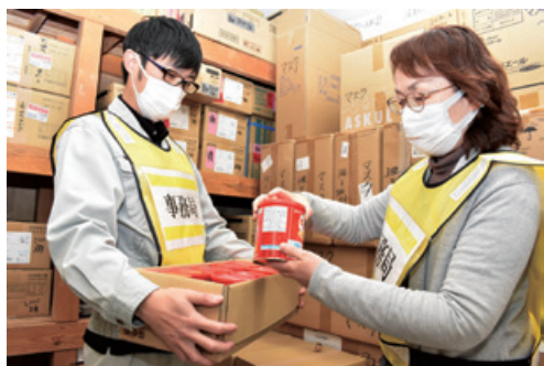
備蓄品の在庫確認を行うJA邑楽館林の職員

当金庫は、こうしたJAによる防災拠点化の取組みを、JAバンクとしての全国的な対応として拡大させるべく、JA邑楽館林等のJAへヒアリングを行いました。そこで得たノウハウをもとに、全国どのJAでも防災拠点化に取り組めるよう、防災拠点化の考え方や検討手順、そして具体的に取り組むべき内容をまとめたマニュアルと事例集を2024年度に作成しJAバンク内で展開しました。