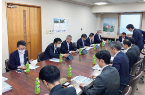
プログラム導入JAとのキックオフミーティング風景

2024年度までの累計で延べ84JAに本プログラムを導入してきました。導入JAでは貸出残高および新規実行額ともに全国平均と比べても堅調な実績を上げており、取組みの成果が表れています。また導入したJAからは本プログラムを通じて貸出強化の重要性が組織内に浸透したとの声もいただいています。なお、貸出業務はJA自身の収益力強化に加え、JAが金融仲介機能を発揮するうえでも重要な業務です。本プログラムを含めた様々な取組みを通じて、組合員・利用者目線でのサービス提供に注力してまいります。