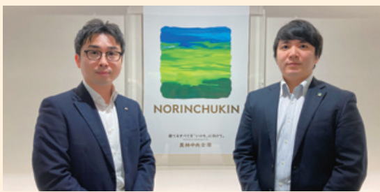
JAバンク統括部 リテール戦略グループ