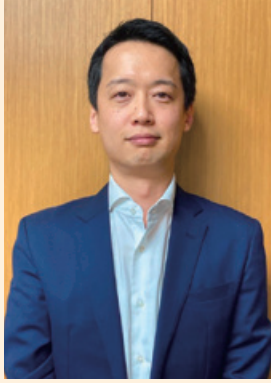
JAバンクリテール実践部 貸出強化実践グループ 部長代理