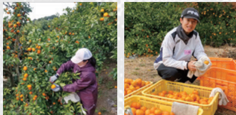
役職員がパーパスの意義を再認識するための援農支援活動

地球温暖化や台風被害などによる農林水産業への影響は年々深刻の色合いを濃くしています。また、不安定な世界情勢、様々な社会課題など、先々の不確実性が高まるなか、「私たちは世の中にどう貢献するのか」、役職員で改めて検討を重ね、その答えをステークホルダーのみなさまとともに実現するため、自らのパーパスを定めました。