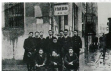
産業組合中央金庫開設当時の事務所

戦前・戦後から高度経済成長期にいたるまで、日本の農林水産業は資金不足の状態が続いていました。その解消を目指して1923年に設立されたのが、私たち農林中央金庫です。