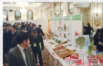
東北の食と農の商談会 ～震災復興そして農林水産業の成長に向けて～

農林水産業をめぐる環境変化や経済金融情勢の変化等を踏まえ、私たちは系統組織が一体となった事業運営に舵を切り、JAバンクシステム・JFマリンバンクシステムを開始しました。私たちは全国機関としての役割発揮に努め、特に2011年の東日本大震災では、「復興支援プログラム」を創設し、被災地域の農林水産業者・会員を全力かつ多面的に支援しました。