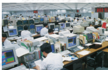
本店内のディーリングルーム

組合員や地域の利用者のみなさまからお預かりした貯金が大きく伸びてきた1970年代以降、私たちは、農林水産業に関連する企業への投融資や、国内短期資金市場への資金供給、日本国債への投資などを通じて、わが国の旺盛な資金需要に応えてきました。