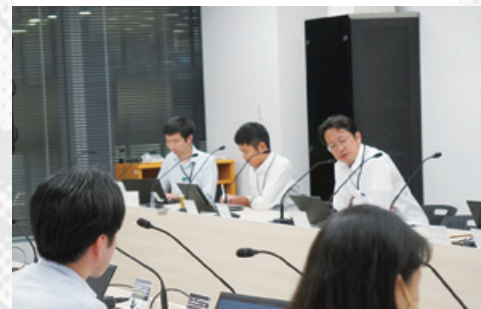
中期ビジョンの職員向けフィードバック

これまでの100年、当金庫は農林水産業の維持・発展に強い思いをもって事業運営にあたってまいりました。