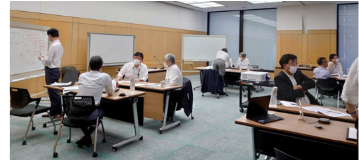
役員ワークショップでのグループディスカッションの様子