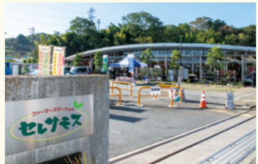
セレスモス麻生店