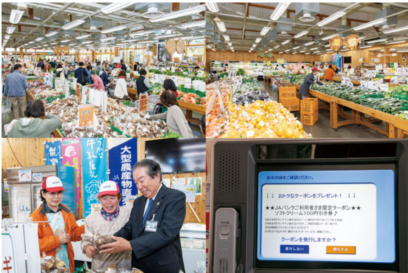
(左上からZ字順に)「セレスモス麻生店」開店してすぐの様子。開店前に新鮮な野菜や果物が次々と生産者から持ち込まれる。歓談する生産者と原組長。ATM利用者に発行される「ソフトクリーム100円引き券」(期間限定クーポン) 発券時の画面。

日本では全国に約20万台の銀行ATMが存在するなか、キャッシュレス化の流れとともに各金融